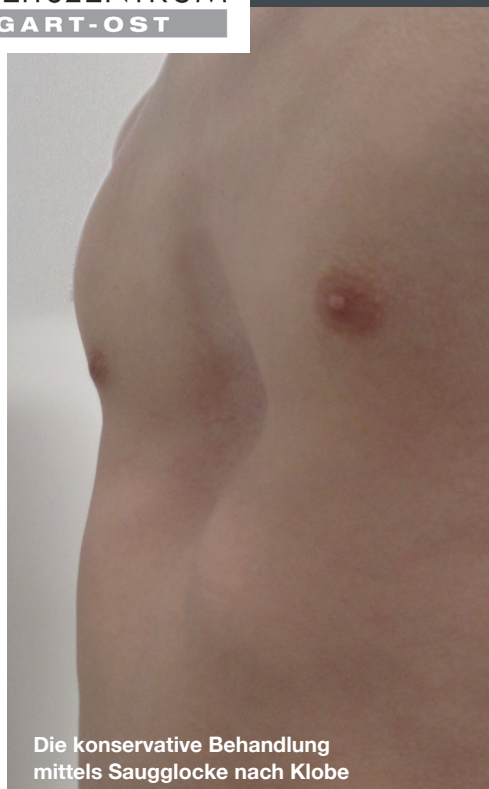
Die konservative Behandlung mittels Saugglocke nach Klobe

EINE KURZINFORMATION FÜR PATIENTEN, ELTERN, ÄRZTE UND KRANKENGYMNASTEN