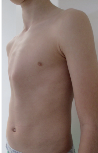
Patient schräg, deutliche Kielbrustdeformität