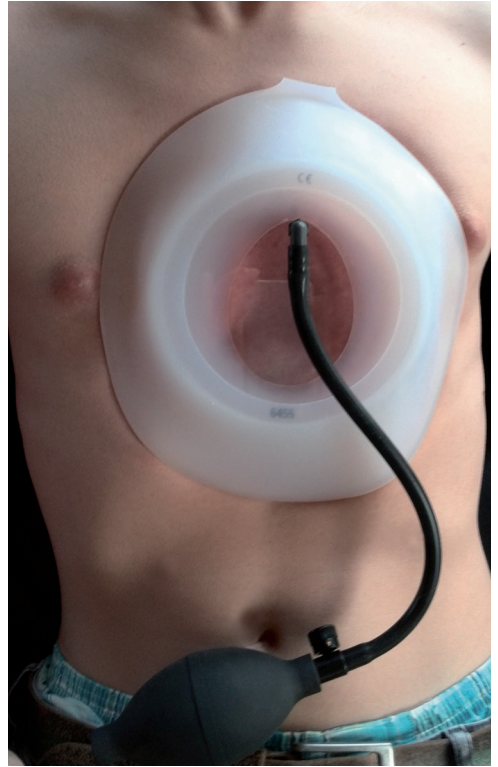
Patient mit Saugglocke