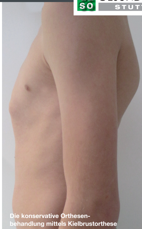
Die konservative Orthesen- behandlung mittels Kielbrustorthese