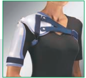
Farbe: Kunststoff transparent, Polstermaterial blau.