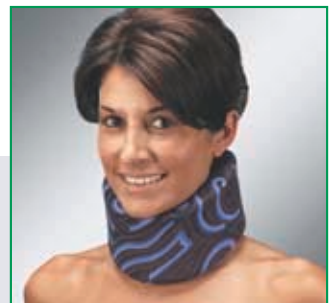
Farben: haut, bunt.